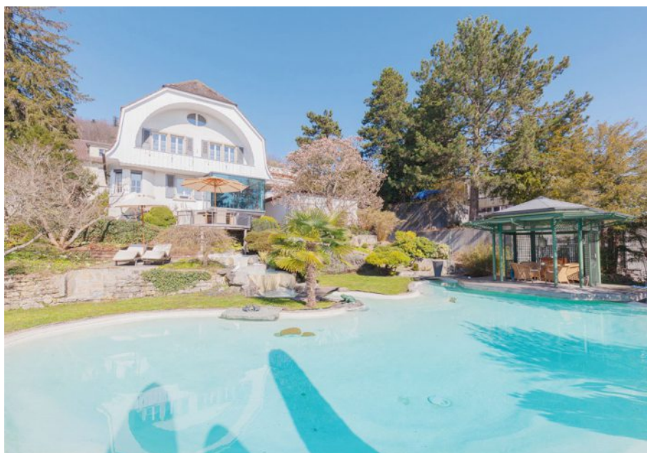
Der Garten ähnelt einem Park und ist sehr einladend.