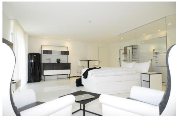
homeSUITE mit In-Room Küche, 44-46 m